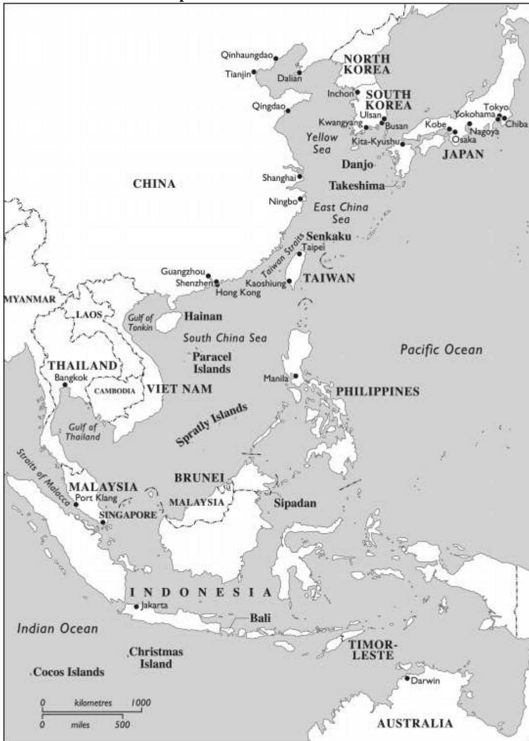
Mapa 1 - O Mar do Sul da China